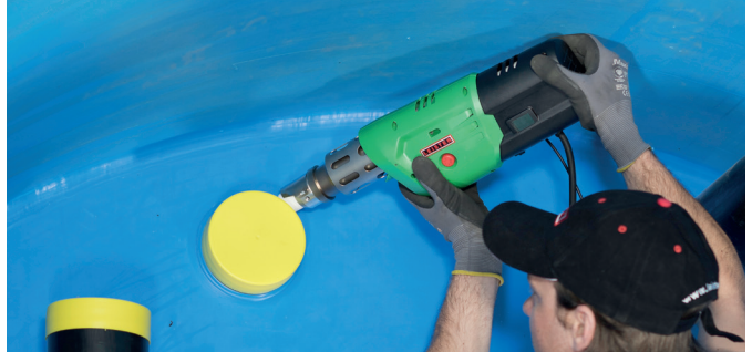
FUSION 1: mayor flexibilidad durante la soldadura gracias a su fino diseño.